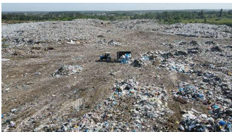
Фото 8. Полігон ТПВ м.Житомир

Динаміка основних показників управління з відходами I-IV класів небезпеки, тис. т