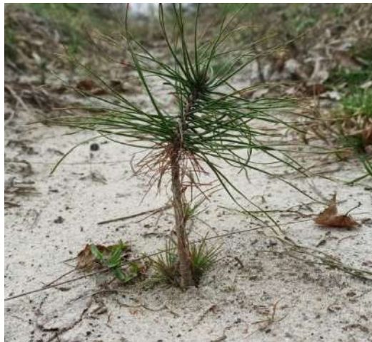
Фото 3. Сосна звичайна ( Pinus sylvestris L.)