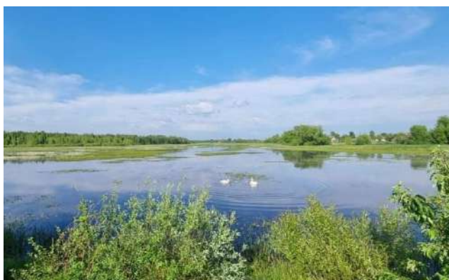
Фото 2. Річка Жерев Житомирської області

Площа Житомирської області становить 29,9 тис.км 2 (4,9% території України), територіально розташована в межах басейну річки Дніпро.