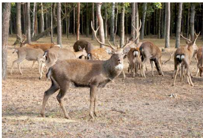
Фото 5. Явненське лісництво філія «Баранівське ЛМГ» ДП «Ліси України», олень плямистий ( Cervus nippon )

На території області нараховується понад шістдесят видів ссавців, близько трьохсот видів птахів, вісім плазунів, одинадцять земноводних, близько тридцяти видів риб і круглоротих.