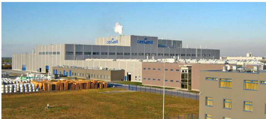
Фото 1. ТОВ «ЦЕРСАНІТ ІНВЕСТ»

Дата 24 лютого 2022 року стала поділом на “до” і “після” для всієї України.