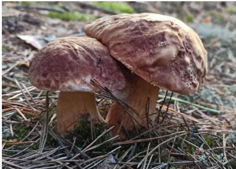
Фото 6. Боровик у гідрологічному заказнику «Прибитоцький».

Станом на 01.01.2024 р. до складу природно-заповідного фонду Житомирської області входить 284 об'єкти природно-заповідного фонду загальною площею 143203,7814 га, з них 20 об'єктів загальнодержавного значення (їх площа становить 57940,04 га) та 264 об'єктів місцевого значення (їх площа становить 85263,7414 га). Відсоток заповідності становить 4,75 %.