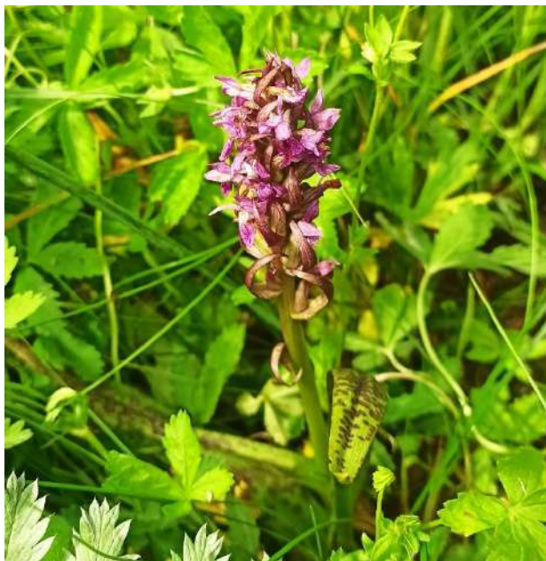
Фото 4. Пальчатокорінник плямисто-кривавий ( Dactylorhiza cruentha (O.F.Müll.) Soó).

На Житомирщині зустрічається близько 1600 видів судинних рослин, 294 види мохоподібних, 250 видів лишайників та ліхенофільних грибів. Серед судинних рослин в області першу десятку за кількістю видів утворюють такі родини: айстрові (243 види), злакові (132 види), осокові (84), губоцвіті (63), бобові (60), ранникові (58), гвоздичні (58), капустяні (57), розові (55), зонтичні (52). Список рідкісних видів флори області нараховує 227 видів судинних рослин. На Житомирщині нині відомі єдині в Україні локалітети конюшини Спригіна ( Trifolium spryginii ), водяного жовтецю плаваючого ( Batrachium fluitans ), глоду дюнного ( Crataegus dunensis ).